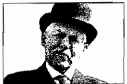
Fotografen Jacob A. Riis fra Ribe fotograferede i USA.