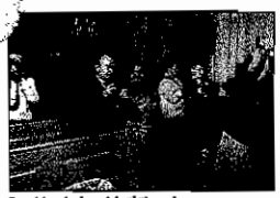
Der blev knipset livrigt ved konfirmationen i Føvling Kirke.